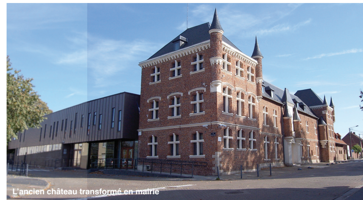
L'ancien château transformé en mairie