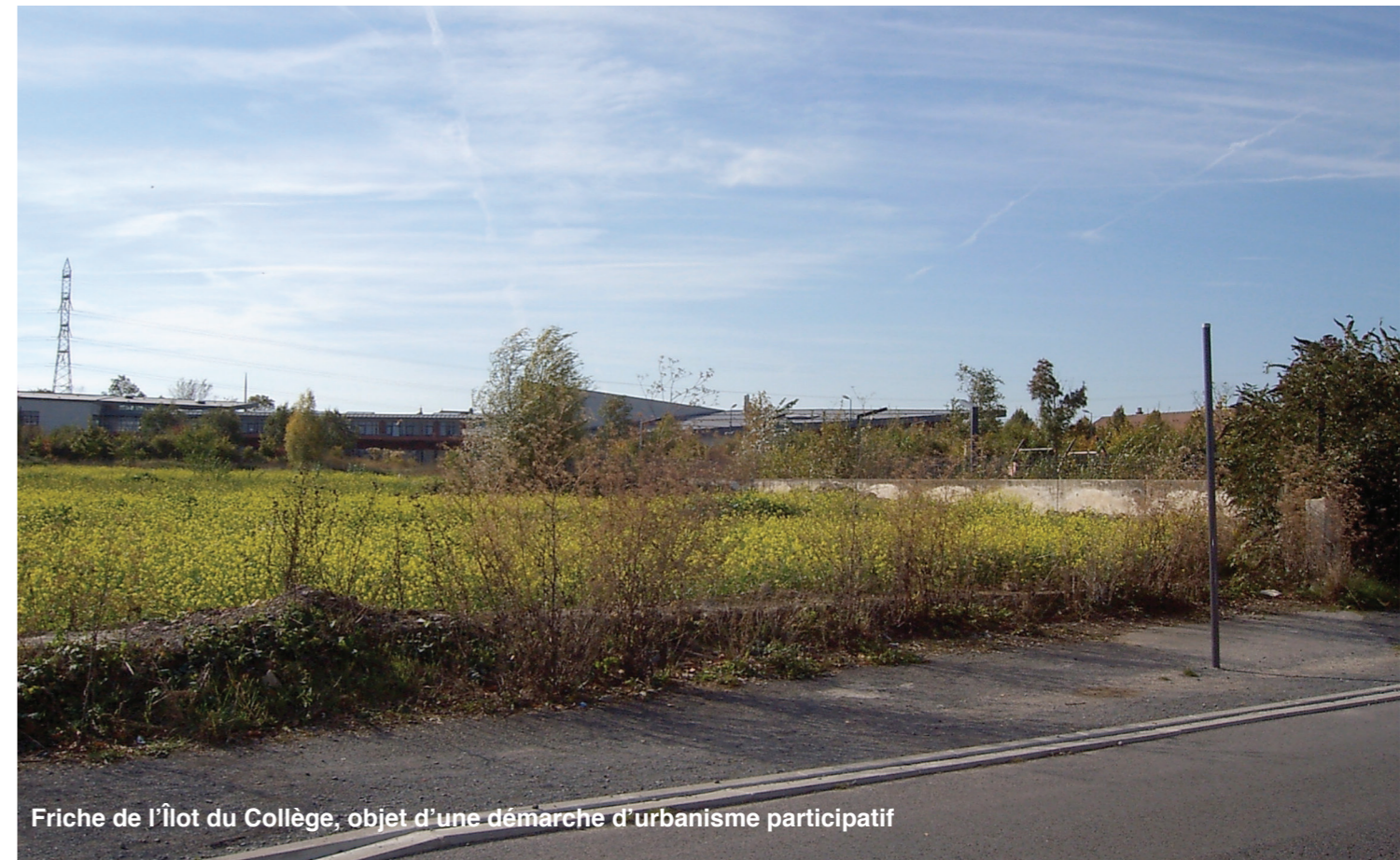
Friche de l'Îlot du Collège, objet d'une démarche d'urbanisme participatif