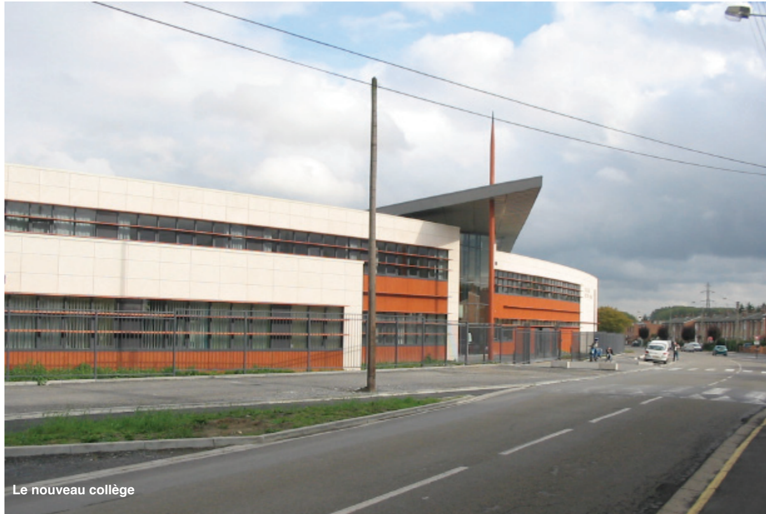
Le nouveau collège