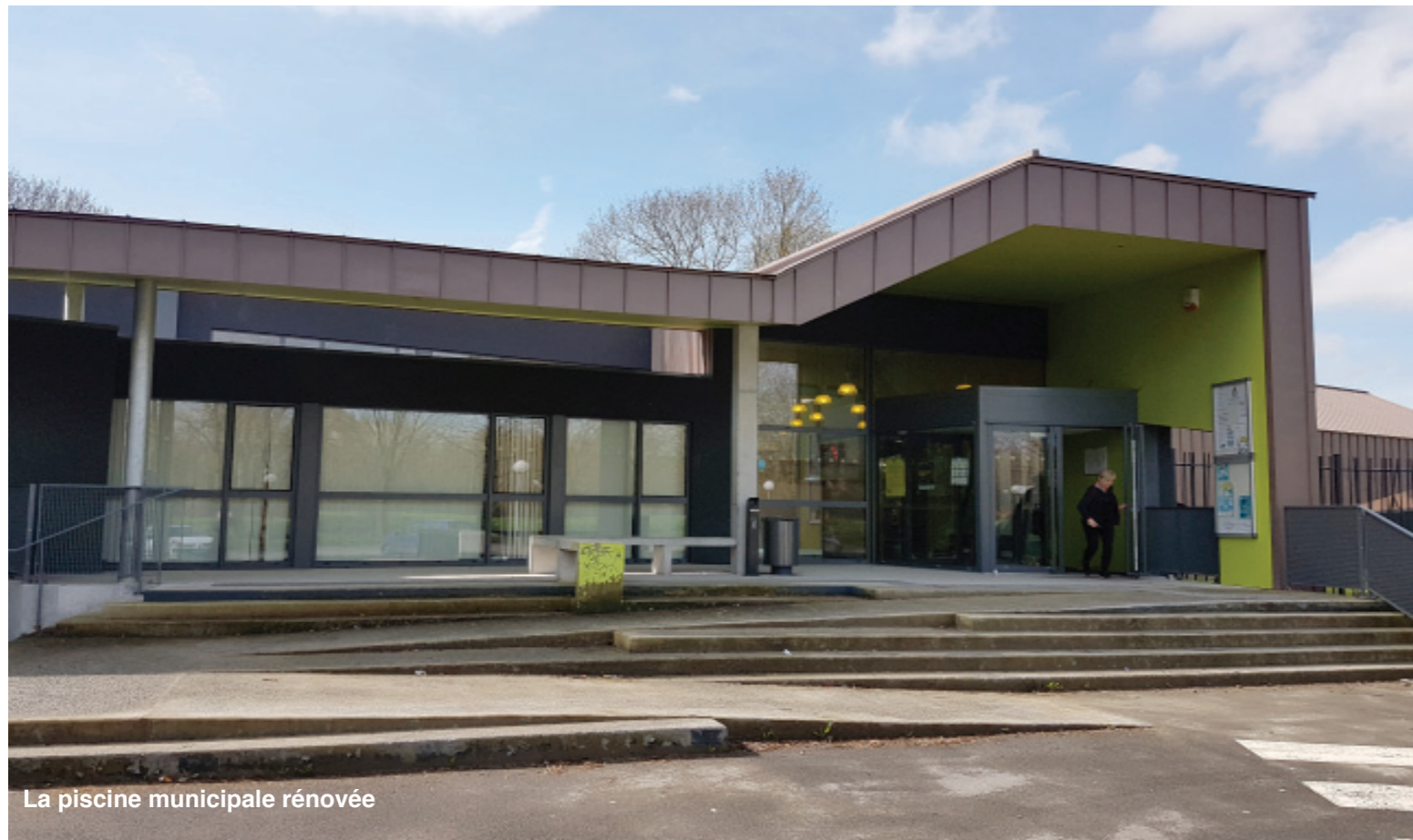
La piscine municipale rénovée