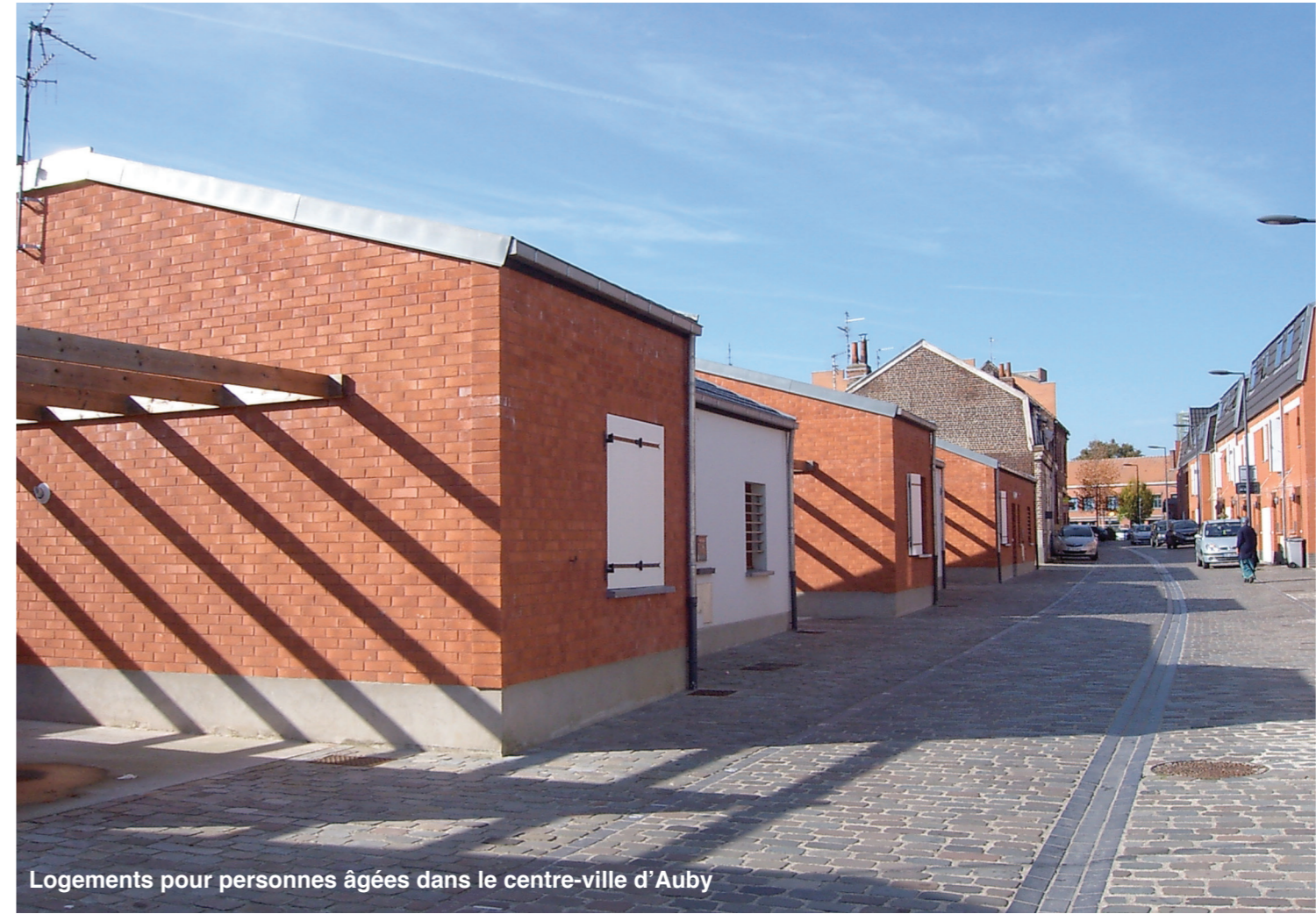
Logements pour personnes âgées dans le centre-ville d'Auby