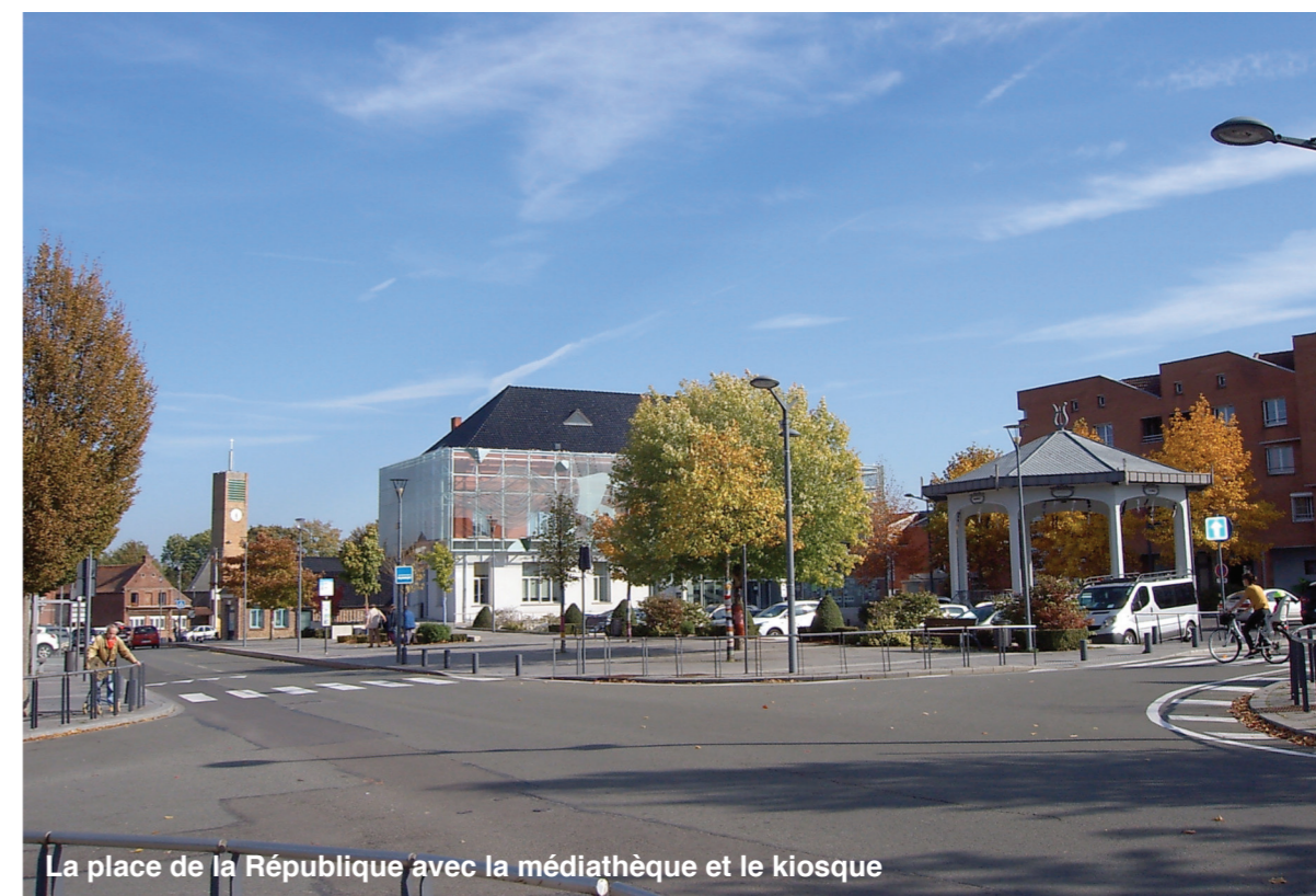
La place de la République avec la médiathèque et le kiosque